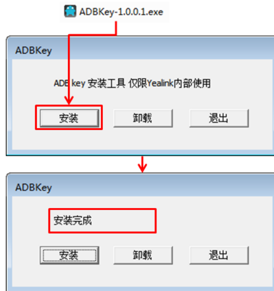
图 2 - 2 ADBKey 安装流程图